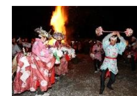
一之瀬高橋の春駒