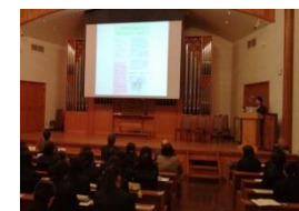
ユネスコスクール