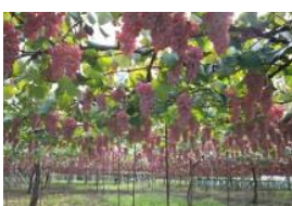
日本一の生産量を誇る棚式栽培による ブドウ畑