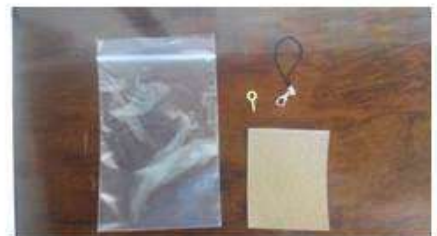
紙ヤスリ、ストラップセット